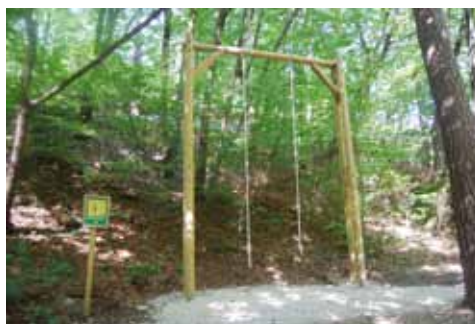
Trim steza omogoča aerobno vadbo s tekom ali hojo kot tudi fitness v naravi.

»Dolina Završnice je biser narave na območju naše občine, ki ga želimo obenem izkoristiti in zaščititi. Aktivnosti v dolini potekajo že dolgo, a neorganizirano, kar je imelo negativen vpliv na okolje. Poleg tega smo želeli obiskovalcem ponuditi nove vsebine, ki povezujejo šport, rekreacijo in turizem,« je na tiskovni konferenci razložil žirovniški župan. Priložnost za uresničitev idej se je ponudila s pridobitvijo evropskih sredstev na razpisu projekta Slow tourism pred tremi leti.