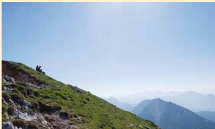
Počitek na vrhu

Upravičeno smo lahko ponosni na naš Stol, kamor planinarji naklonjeni Kašarji množično »romamo« vsaj enkrat na leto.