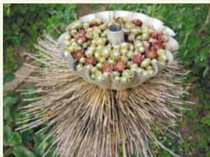
Vrtna reciklaža - potica iz netreskov, na stari metli

Velik križ je s križnicami (zelje, brokoli, cvetača, koleraba, ohrovt, rukola, redkvice, ...), ki so dobile ime po cvetu v obliki križca. Ne bo si težko zapomniti, da se križnice hitro skrižajo med seboj, če cvetijo istočasno. Profesionalno zato gojijo posamezno vrsto zelenjave izolirano od ostalih, istočasno vsaj 50 do 100 primerkov zeljnatih glav, ki so presajene v rastlinjakih ali obešene z glavo navzdol preživele zimo. Številčnost zagotavlja ohranjanje široke palete genov. Po tem jim križno zarezajo glave, da se cvetni listi lažje prebijajo proti soncu. Če pa doma posadimo uspešno prezimljeno zelje, istočasno pa zacveti npr. koleraba, se rado zgodi, da nam naslednje leto iz semena poženejo rastline, ki ne bodo ne tič ne miš. Zelje, ki ne bo delalo glav, z nekoliko odebeljenim stebлом. Zato bolje, da semenimo vsako leto le eno vrsto križnice. Prav tako ni pametno pobirati semena od rastlin, ki prehitro uidejo v cvet (brokoli in cvetača). Gen, ki je sprožil hitro cvetenje, bo v semenu še ojačan, tako bo pridelek naslednje leto še prej zacvetel. A kot pravi Cortese – tudi to cvetje je odlično za pod zob.