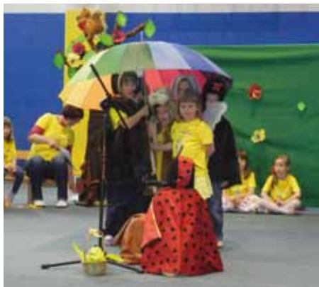
Pod medvedovim dežnikom

V vrtcu smo skozi celo leto na različne načine spodbujali bralno pismenost pri otrocih. Projekt smo zaključili s prireditvijo za starše v Dvorani pod Stolom.