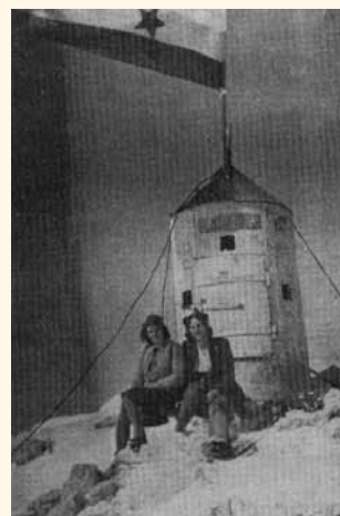
Z leve: Tanja in Vlasta, na Aljaževem stolpu plapolala slovenska zastava.