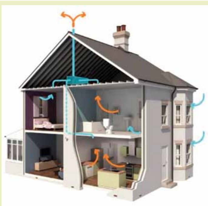
Enostaven sistem naravnega (pasivnega) prezračevanja stavbe