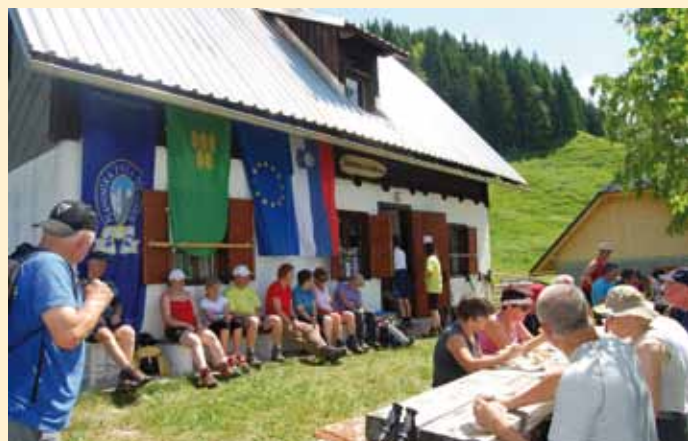
Počitek na Žirovniški planini

No, malo po šesti uri, ko se uradno začne pohod, pride glavina pohodnikov. Ti morajo že malo počakati v vrsti za vpis, vmes pa