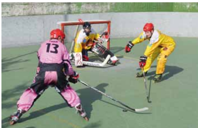
Trim Tim v akciji

Po 46 igralnih dneh, 169 odigranih tekmah in številnih težavah z vremenom se je 29. 6. zaključilo letošnje tekmovanje v ligi RIHL, ki je ime nosilo po glavnem pokrovitelju ProSports. Na tekmovanju je v dveh kakovostnih ligah nastopilo 17 ekip.