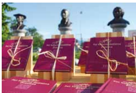
Predstavitve knjižice je bila 20. junija pred Alejo velikih rojakov.

Prenovljena knjižica je tretja, ki jo je o Poti kulturne dediščine izdala Osnovna šola Žirovnica. Prva je nastala ob otvoritvi Poti kulturne dediščine leta 1980 in druga, prenovljena izdaja, leta 1996. Izvodi obeh so do danes pošli, zato so se v šoli odločili za izdajo nove, vsebinsko in oblikovno obogatene izdaje. Knjižica poleg opisa Poti kulturne dediščine vsebuje kratke opise desetih vasi pod Stolom in njihove znamenitosti. Posebna poglavja so posvečena še