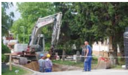
Občine so edine, ki izvajajo projekte

Moti me, da ni resnih izračunov, koliko in kje bi z ukrepom prihranili. Izjavo, da to pomeni 100 županskih plač manj iz državne blagajne, naj pokomentiram, da gre za 100 majhnih občin in 100 majhnih županskih plač, kar bi pomenilo kapljo v morje. Poleg tega so občine edine, ki v zadnjih letih izvajajo in vodijo projekte kot na primer gradnje kanalizacijskih sistemov, cest, vrtcev, šol in črpajo evropska sredstva. Na drugi strani težko govorimo o uspešnih investicijah države; projekti Šoštanj, drugi tir, šentviški predor ... so vsem znane zgodbe.