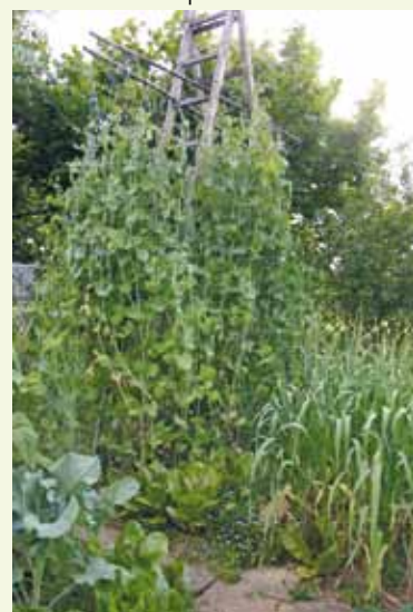
Ko je malar odšel, si je dvome-trski grah vsel lestev zase - stara sorta iz Železnikov

Minimalna verjetnost križanja obstaja pri solatnicah (razen endivije in radiča, ki se oženi s cikoriijo), blitvi, špinaci, fižolu, grahu, paradižniku (kjer se pobira seme iz sredine plodov v vrhuncu sezone obiranja in ga lahko potem pustimo fermentirati v lastnem soku), papriki (ki pa se skriža s čilijem). Vseeno je priporočljivo, da so različne sorte razmaknjene vsaj 1 m.