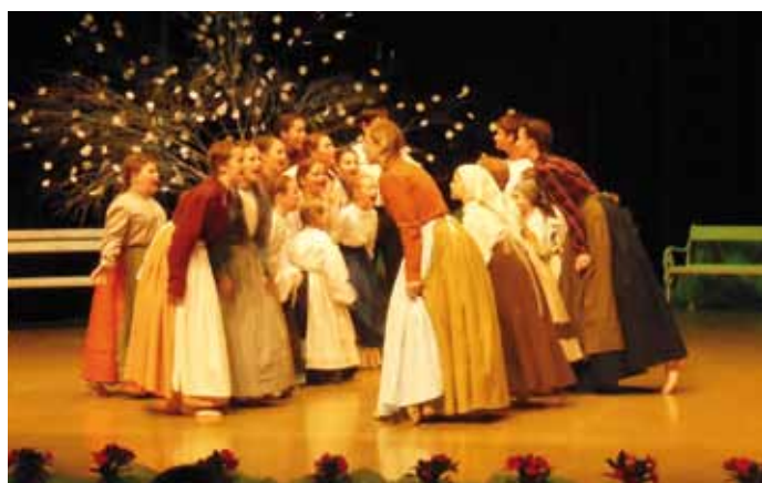
Brezniški folklorniki so na festivalu nastopili s postavitvijo »Ta kašarska fara«.

Zavod RS za šolstvo in I. osnovna šola Rogaška Slatina sta že 17. leto zapored razpisala revijo ljudskih plesov, pesmi in običajev z naslovom »Pika poka pod goro«. V razpisu smo člani Otroške folklorne skupine Breznica videli priložnost, da se predstavimo novemu občinstvu si poleg tega ogledamo še lepe kraje na drugi strani Slovenije.