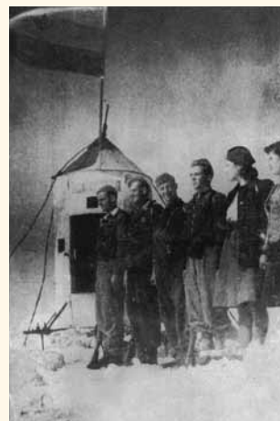
Skupina, ki je oktobra 1944 ponesla zastavo na Triglav.

Odredili so ji dolžnost »delo z mladino na terenu«. Vsak večer je obiskovala mlade po vaseh. Namen sestankov je bil tudi obveščanje ljudi o vojnih razmerah po svetu in zbiranje informa-