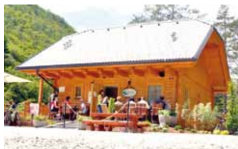
Gostinski lokal Zavrh ponuja osvežitev v objemu narave.