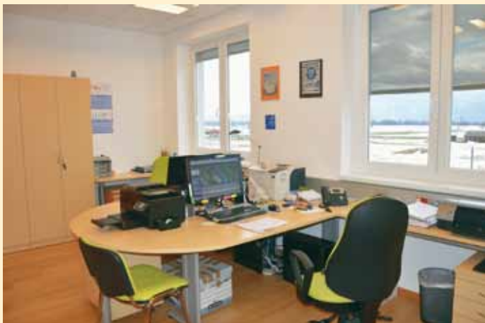
Svetli prostori v nadstropju stavbe

Objekt s skupno uporabno površino 543 m 2 obsega klet, pritličje, nadstropje in mansardo. V pritličju se nahajajo večja sejna soba z možnostjo pregraditve, sprejemna pisarna in pisarna župana, v nadstropju pa manjša sejna soba s kuhinjo in šest pisarniških prostorov. Kletni prostor je namenjen kurilnici, arhivu in skladišču za opremo civilne zaščite. Mansarda zaenkrat ni izkoriščena, a dopušča možnost kasnejše ureditve in uporabe. Objekt ima dvigalo, dostop za invalide, zunanost je prilagojena obstoječim objektom, za ogrevanje oz. hlajenje objekta se bo uporabljala toplotna črpalka v kombinaciji s plinom.