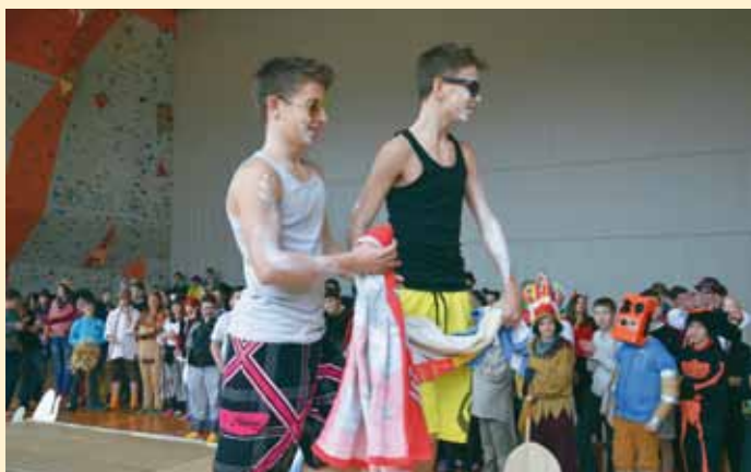
Nekateri so dan izkoristili za obisk plaže.