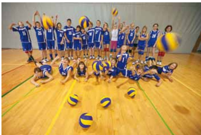
Mini in mala odbojka, OK Žirovnica

Člani , ki nas zelo uspešno zastopajo v 2. najmočnejši ligi v državi, so bili še nekaj krogov nazaj tik za petami drugouvrščeni ekipi iz Šempetra. Forma ekipe je rasla, vendar pa je žal na tekmi proti Šempetru odločila izkušnost. Po porazu je ekipa padla v krajšo rezultatsko krizo, ki pa se končuje. Najverjetneje bodo fantje na koncu zasedli visoko 3. mesto.