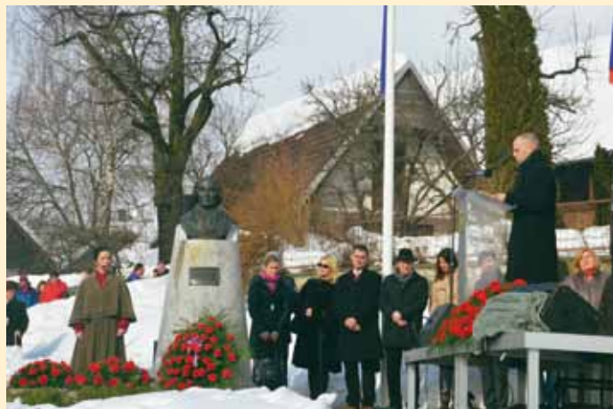
Slovesnost v Vrbi, govornik minister dr. Uroš Grilc

V Vrbi se je ob kulturnem prazniku zbralo nekaj sto ljudi. Slavnostni govornik na osrednji prireditvi je bil minister za kulturo dr. Uroš Grilc. Vrba v znamenju 170. obletnice Zdravljice.