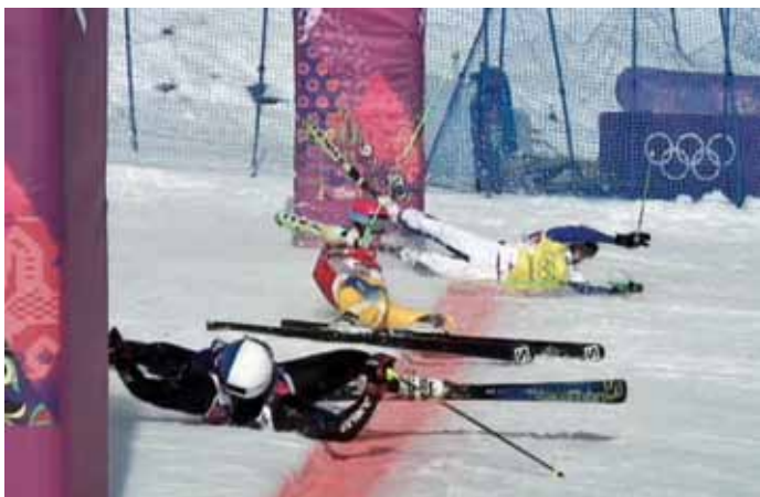
Finiš tekme v ski krosu, kot ga je v objektiv ujel Tomaž Knafelj

Trenutno igram v Oskarshamnu na Švedskem, kjer tudi živim. Po koncu sezone se z družino selimo v Radovljico, potem se začne lov na novo ekipo. Upam seveda na najboljšo.