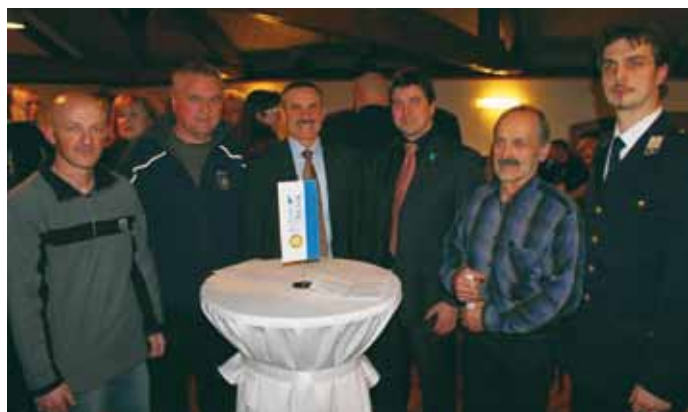
Na srečanju s člani Rotary kluba Zgornji Brnik

Tudi na operativne področju se je leto pričelo pestro. Poleg tega, da smo pomagali na prireditvi v Vrbi, smo imeli že štiri intervencije. K sreči niso bile velike, vendar se tudi iz majhnih stvari lahko razvije katastrofa, če ne posredujemo hitro in strokovno.