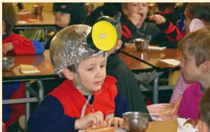
Imeli smo malico – takšno za rudarje 😊