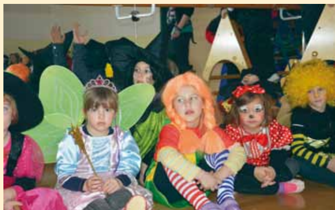
Ogledali smo si ples vzgojiteljic.