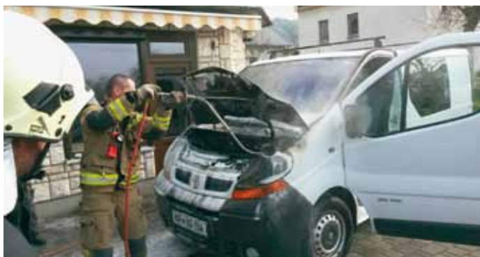
Požar vozila v Žirovnici

zabeležili požar vozila v Žirovnici, kamor je v najkrajšem času prihitelo šest naših članov.