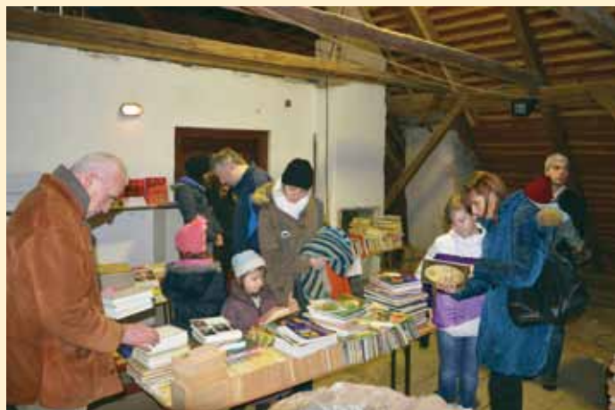
Bukvarsk smn na podstrešju Prešernove hiše

Letošnji kulturni praznik je malone zasenčila ledena ujma, ki je v svoj primež ujela dobršen del Slovenije, česar se je v uvodu svojega govora v Vrbi dotaknil tudi minister dr. Uroš Grilc . Dejal je, da je kultura le na prvi pogled stopila v ozadje, saj se ljudje, kadar nas narava stisne v kot, izkažemo s solidarnostjo, strpnostjo in potrpežljivostjo, to pa so kategorije, ki so v prvi vrsti kategorije kulture. »V času, ko je bitka za našo nacionalno državo že izbojevana,« je nadaljeval govornik, »sedanjost pa na nas v obliki gospodarske krize naslavlja nove izzive, je pomembno poskrbeti za to, da naše spoštovanje kulture in umetnosti ne ostane zgolj na deklarativni ravni. Retorika krize se sklicuje na to, da je treba v imenu varčevanja zamrzniti vse, kar se na prvi pogled ne zdi življenjsko pomembno. Ta retorika kulturo rada prikazuje kot nekakšno razkošje, rezervirano za obdobja prosperitete. A prav v časih, kot je današnji, je treba poudariti, da kultura ni nekakšen modni dodatek, ki se mu zlahka odrečemo, temveč gonilna sila človekovega razvoja. Kultura je sila, ki s svojim prispevkom spreminja našo družbeno resničnost in ki jo moramo podpreti, če si želimo sprememb. Kultura je pot našega razvoja. Časi so težki, ampak moderni,« je svoj govor sklenil minister, »naklonjeni so drznosti in eksperimentom, prav kličejo po tem.«