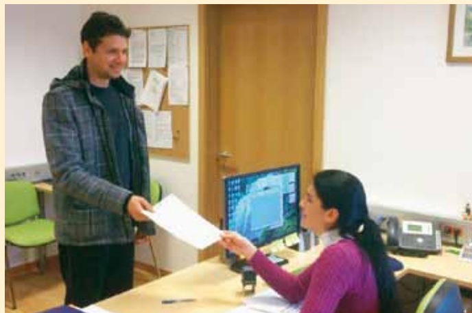
Ob obisku nove občine zadovoljni tudi uporabniki