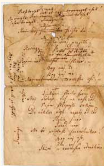
Drugi zapis Zdravljice, 1844. Tu so vidni pesnikovi popravki besedila. Rokopis hrani NUK.

Ljubezni sladke spona Naj vežejo vas na naš rod, V njim sklepajte zakone De nikdar več naprej od tod Hčer, sinov Zarod nov Ne bo pajdaš sovražnikov!