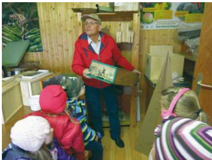
Šolski čebelnjak obiskujejo tudi vrtičkarji.