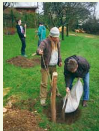
Sajenje dreves za šolo

V letošnjem letu se akcija sajenja dreves širi in dobiva nove razsežnosti. Projekt Boš sadiv? smo predstavili na koordinaciji gornjegorenjskih občin in dobili (tudi finančno) podporo županov občin Radovljica, Bled, Gornje, Bohinj, Jesenice, Žirovnica in Kranjska gora. Občine bodo pokrile stroške sadik, opornikov in zaščitnih mrež, za vse ostalo pa bomo poprijeli za lopate in zavihal rokave člani društva in prostovoljci. Veseli bomo vsake vaše pomoči, s seboj lahko prinesete tudi kakšno orodje – kramp ali lopato – ter obilico dobre volje.