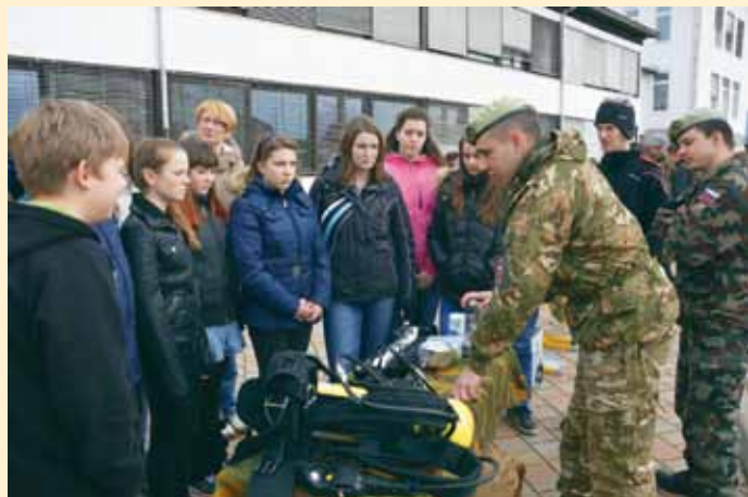
Predstavitev vojaških poklicev