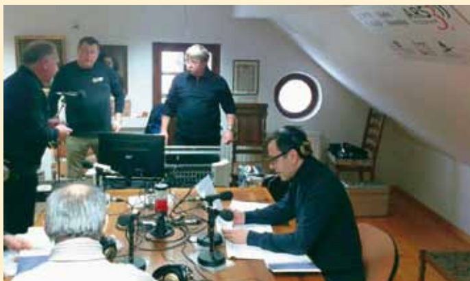
Gostujoči studio Radia Slovenije – Studio Ars v Čopovi hiši