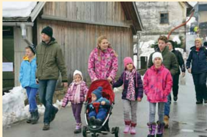
Družinski obisk Vrbe ob kulturnem prazniku