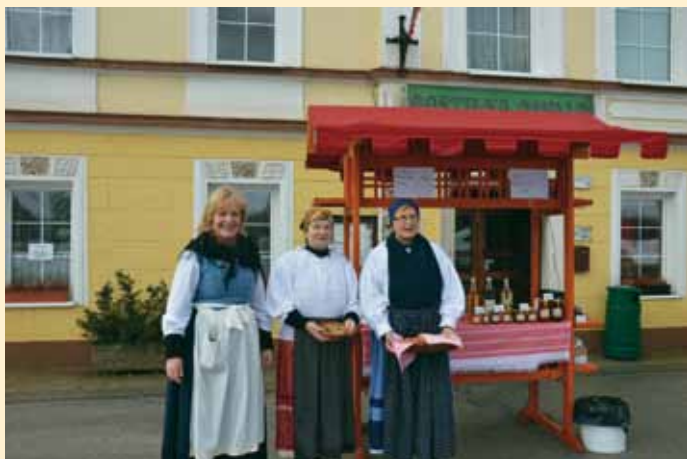
Prijazen sprejem pohodnikov pred gostilno Oswald

170 let Zdravljice, radio Ars v živo iz Čopove hiše Ponudba, ki jo je pripravil Zavod za turizem in kulturo Žirovnica je bila letos zaznamovana s 170. obletnico Zdravljice. Obiskovalci Vrbe so si v Manufakturi Mojstra Janeza lahko natisnili faksimile Zdravljice, na prodaj je bilo 170 oštevilčenih steklenic vina, na posebni stojnici pa je bilo moč kupiti tudi knjigo Zdravljica in njena pot v svet, v kateri je zbranih 26 prevodov Zdravljice. Knjigo sta ob obletnici izdala Medium Žirovnica in ZTK Žirovnica. Nove in stare in knjige pa so zasedle podstrešje Prešernove rojstne hiše, kjer je potekal »bukvarski smn«. Dogajanje na Poti kulturne dediščine Žirovnica je ves dan spremljal 3. program Radia Slovenija – Studio Ars. Iz gostujočega studia v Čopovi hiši je povezal Prešernov rojstni kraj in Prešernov trg v Ljubljani, kjer je potekal recital slovenskih igralcev. Glas iz Žirovnice se je tako slišal širom Slovenije. Poslušalcem so bile predstavljene vse tri rojstne hiše, delovanje Zavoda za turizem in kulturo, prisluhnili so tudi Zdravljici v različnih jezikih.