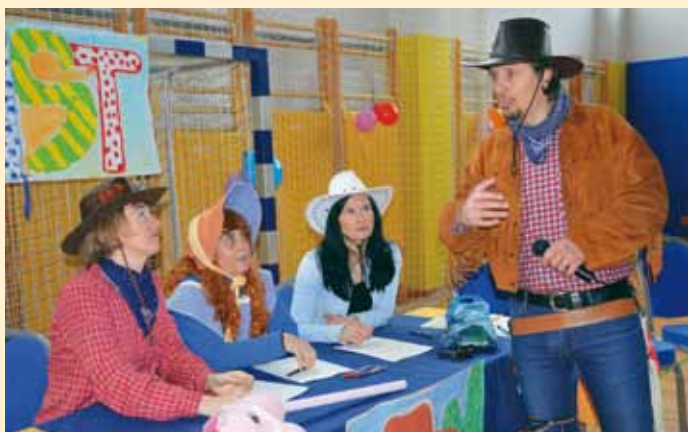
Na pustni torek se res ni spraševalo, saj so naše učiteljice in učitelji mislili, da so na Divjem zahodu.