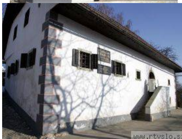
V sredo bodo začeli zadnja letošnja investicijsko-vzdrževalna dela - sanacijo strehe nad sanitarijami Prešernove rojstne hiše.