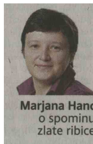
Marjana Hanc o spominu zlate ribice

S ročelja kranjskega sodišča po drugi »akciji« v noči na 12. avgust še vedno kričijo napisi Fašistične svinje in Falanga režimskega apartheida ter Za svobodno in demokratično Slovenijo. Morda gre za kljubovanje, kajti po prvem mazaškem pohodu v noči na 11. julij, ko so grafiti Servis hunte in Fosili ter srpa s kladivoma hitro prebelili, je pročelje ostalo nepokracano le šest dni. Policija na vprašanje, kako ji gre z odkrivanjem storilcev, odgovarja, da zbirajo obvestila in da je verjetno grafito napisal isti človek.