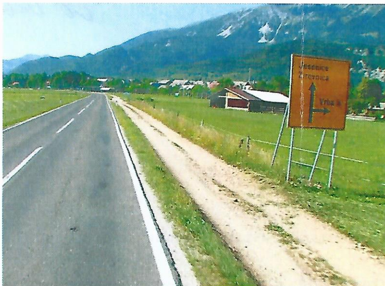
Slika 2: Predkrižiščna tabla

Obveščamo vas, da je obravnavano križišče označeno z ustrežno prometno signalizacijo. Pred križiščem je iz obeh smeri postavljena predkrižiščna tabla III-84, ki označuje medsebojni položaj in smeri cest, ki se križajo, in imena krajev, do katerih peljejo. V samem križišču so postavljeni prometni znaki III-86 »kažipot«. Voznik je torej že predhodno opozorjen na križišče. V samem križišču pa je le-to dodatno definirano s kažipot. Torej zaznava križišča ni težava.