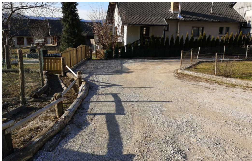
Slika 4: Pogled na obstoječe makadamsko vozišče v smeri proti priključku.