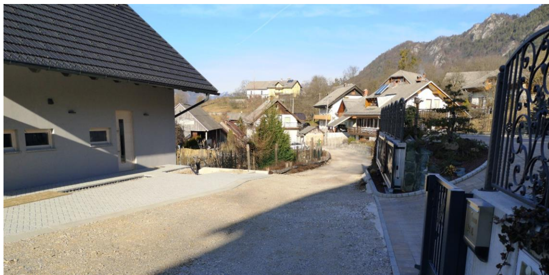
Slika 2: Pogled na obstoječe makadamsko vozišče v smeri proti priključku.