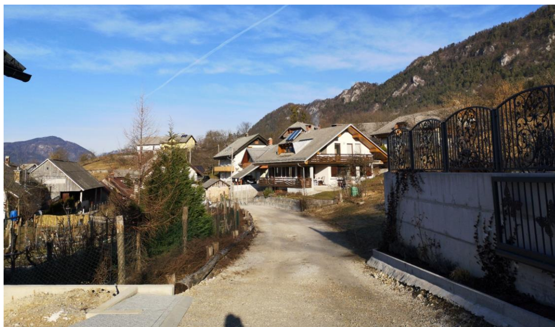
Slika 3: Pogled na obstoječe makadamsko vozišče v smeri proti priključku.