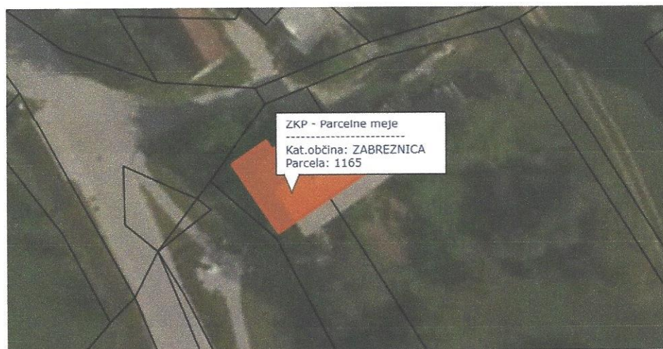
Slika 8: Mikro lokacija (Vrba 1)