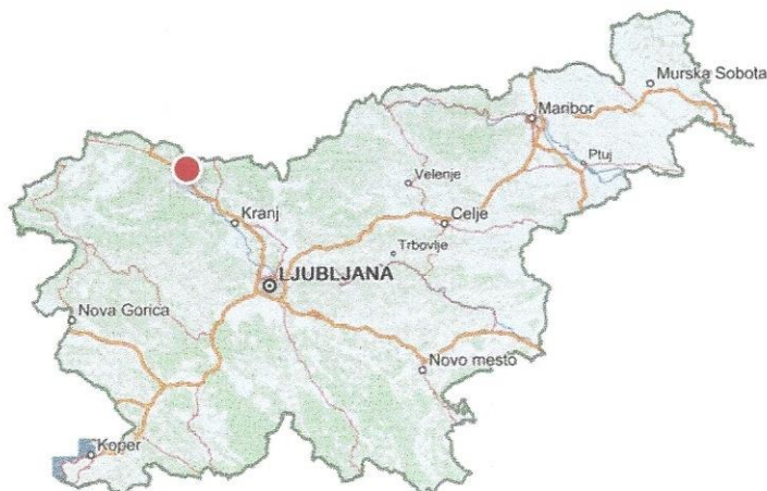
Slika 7: Makro lokacija (Objekt Vrba 1, vas Vrba na Gorenjskem)

Spletni vir: < zemljevid.najdi.si > (Zadnji dostop 12. 8. 2020).