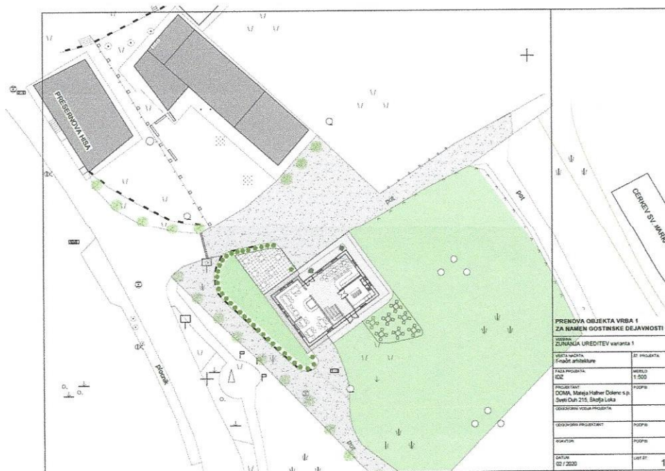
Vir: DIIP: »Revitalizacija objekta Vrba 1«. 19