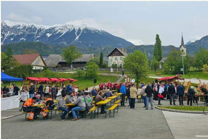
Markov smn v Vrbi

V nedeljo, 28. aprila, je bil v Vrbi ponovno Markov smn. Prireditev ob godu sv. Marka, zaščitnika Vrbe, je prvič potekala leta 1999 na pobudo noneta Vasovalci. V Kulturnem društvu dr. France Prešeren Žirovnica-Breznica so se odločili, da na zadnjo aprilsko nedeljo v Vrbo ponovno povabijo pevce, rokodelce in obiskovalce.