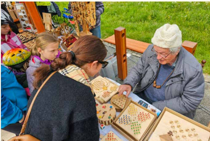
Pestra ponudba na stojnicah