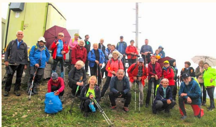
Skupinska na Kupu

Po prvomajskih praznikih je Boris presodil, da je vremenska napoved za nianso boljša od zadnjič, ko je bila tura po sili razmer odpovedana. Tako smo 7. maja vseeno šli na pohod, pripravljene na morebitno poslabšanje.