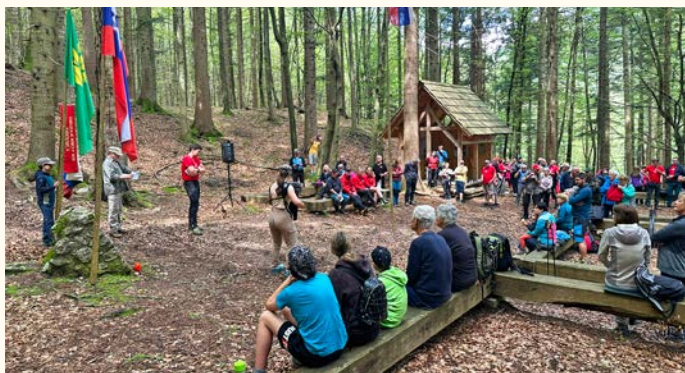
Zbrani v Titovi vasi na dan mladosti, 25. maja