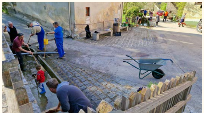
Čiščenje korit v Doslovčah

VO Doslovče se zahvaljuje vaščanom, da so se udeležili čistilne akcije 13. aprila in skupaj pripomogli očistiti vaško jedro ter polepšati našo vas.