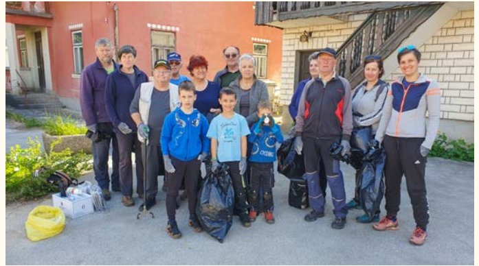
Na Bregu so se razveselili mladih udeležencev akcije.

Zbirni center tudi pripomore, da ob pomladnem čiščenju okoli hiš skoraj ni več kurjenja v naravnem in bivalnem okolju, saj lahko ves zeleni odrez in podobno odpeljemo tja. Naj vas spomnimo, da lahko po predhodni najavi enkrat letno na podjetju Jeko zastoj naročite odvoz odreza.