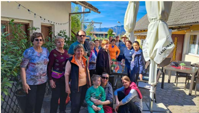
Močna ekipa Selanov

ter skavti stega Pod svobodnim soncem. Očistili smo naselja, dolino Završnice, Piškovco in bankine ob regionalni cesti. Občina je priskrbel potrebne material (vrečke in rokavice) ter zagotovila zaslužno malico, podjetje Jeko, d.o.o., pa je poskrbelo za odvoz zbranih odpadkov.