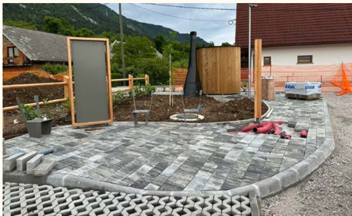
Gradnja vstopne točke v Doslovčah

Kot občani lahko opazite, je v polnem teku gradnja vstopne točke s parkiriščem v Doslovčah , ki bo pomembna pridobitev za domačine in obiskovalce Poti kulturne dediščine.