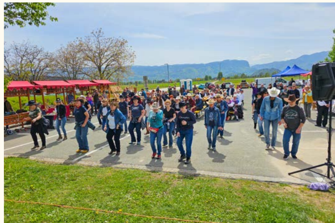
Nastop skupine Wild West Country Line Dance