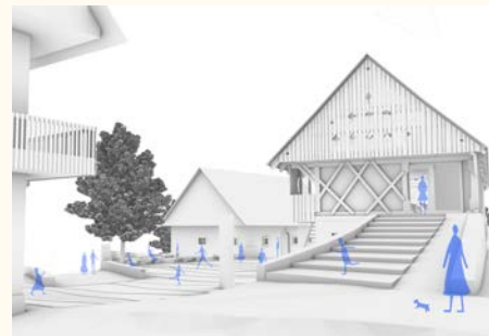
Objekti bodo z zunanjimi površinami povezani v celoto. Atelje Ostan Pavlin

torsko restavratorski posegi na notranjih in zunanjih ometih, kamnitih in lesenih elementih, opečnem tlaku in kovinski stavbni opremi. Obnova bo vključevala tudi celovito komunalno ureditev Prešernove domačije.