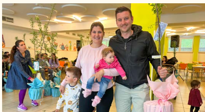
Drugo drevesce za družino Žbogar

Simbolična obdaritev mladih družin ob rojstvu otrok je bila letos že deveta po vrsti. Občina se je za akcijo odločila na pobudo Čebelarke zveze Slovenije, ki na ta način spoduja sajenje medovitih rastlin.