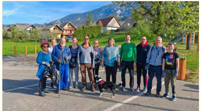
Vrblani so imeli manj dela kot prejšnja leta.

V občinski čistilni akciji je sodelovalo 12 vaščanov Vrbe. Ugotavlja se, da je smeti vsako leto manj, da ljudje postajajo osveščeni in odpadkov v tolikšni meri ne odlagajo več v naravi. Po končani aktivnosti je bila za vse sodelujoče organizirana malica v gostišču Osvald.