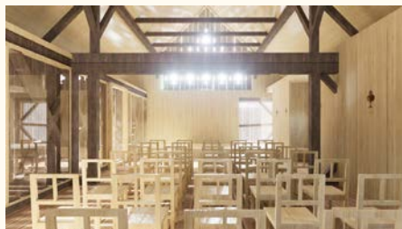
V nadstropju skednja bo urejen večnamenski prostor. Atelje Ostan Pavlin

Po navedbah ministrstva bo v skednju urejen interpretacijski center z vsemi podpornimi in dopolnilnimi programi za muzejsko in kulturno dejavnost. Del te se sedaj izvaja v Prešernovi rojstni hiši, ki bo po obnovi programsko razbremenjena, kompleks domačije pa bo z enotno vsebino povezan v celoto. V pritličje interpretacijskega centra bo umeščena recepcija s prodajo vstopnic, trgovinica in garderoba, prostor za muzejsko predstavitev – razstavo, sanitarije za obiskovalce in servisni prostori.