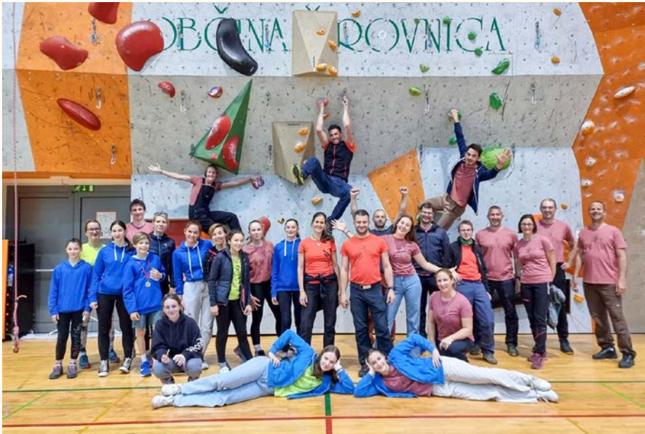
Del izjemne ekipe pomočnikov na tekmi Zahodne lige v Žirovnici.