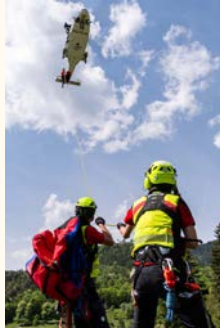
Prikazna vaja helikopterskega reševanja v Begunjah