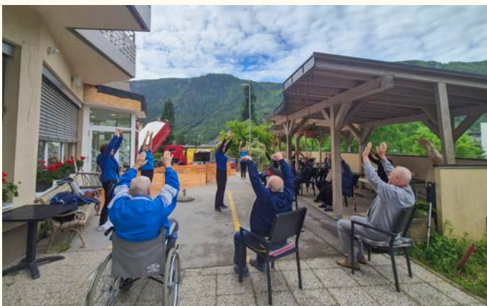
Telovadba z oskrbovanci doma starostnikov na Jesenicah

Članice skupine Jutranja telovadba se vsako jutro redno udeležujemo razgibalnih vaj na dvorišču za Gostiščem Osvald na Selu. Z vadbo na prostem v vsakem vremenu krepimo odpornost, ohranjamo vzdržljivost, ravnotežje, moč, gibljivost in spretnost telesa. Pomembno je tudi druženje.