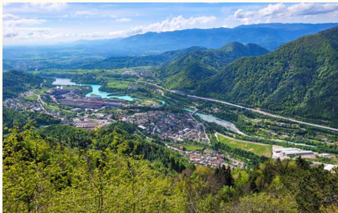
Razgled s poti na Pristavo čez Jelenkamen

Organizator letošnjega srečanja je bilo DU Jesenice. 9. maja smo bili povabljeni na pohod z Jesenic preko Jelenkamna na Pristavo. Na voljo je bila tudi lažja varianta: Dom Pristava, Mali Javornik, Veliki Javornik, Trilobit, Dom Pristava.