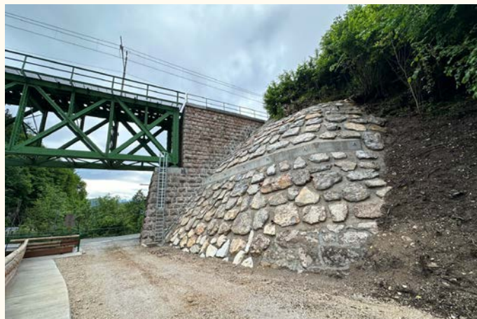
Obnovljen oporni zid železniškega mostu

Med aktualnimi zadevami naj povem, da je v pripravi razpis za projekt obvoznice Vrba , zadnja ocenjena projektantska vrednost projekta znaša nekaj nad 3,1 milijona evrov. Pri odkupih zemljišč rešujemo še zadnji primer, z ostalimi lastniki smo uspeli skleniti dogovor. Končno smo pridobili tudi soglasje DRSI za pločnik ob parkirišču na Rodinah , ki bo zgrajen še v mesecu juniju.