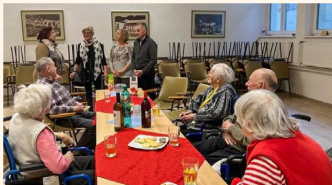
Obisk v Domu dr. Franceta Berglja