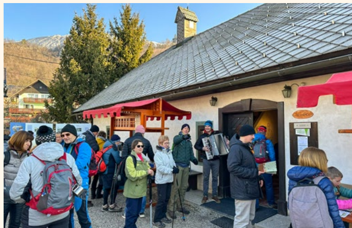
Dobrodošlica s harmoniko pri Čopu

gradnjo obvoznice Vrba, bomo pridobili kvaliteten prostor za razvoj kraja v kulturnem in turističnem smislu.«