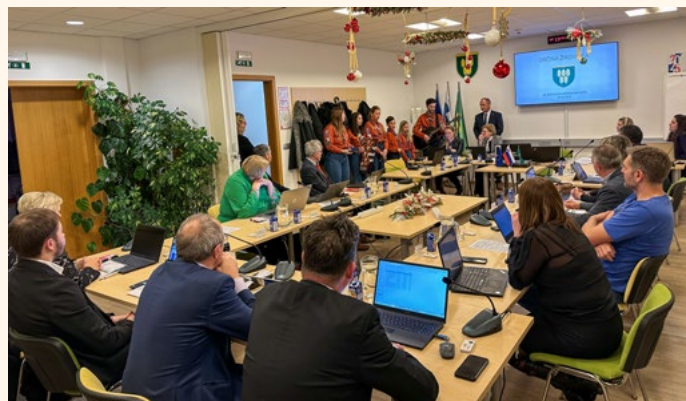
Brezniški skavti na seji občinskega sveta

S poslanico pod geslom »Upaj, zaupaj, stopi« so skavti izrazili prepričanje, da je svet kljub mnogim slabim stvarjem še vedno lep, še lepši pa bo, če bomo sočloveku v stiski stopili naproti.