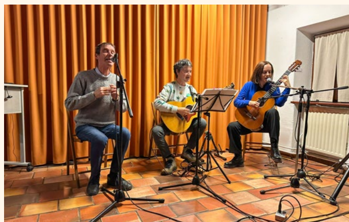
Ponovno v Čopovi hiši – skupina Tantadruj