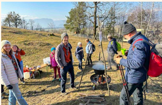
Čaj iz kotla - z njim so pohodnikom v Rebru postregli skavti.