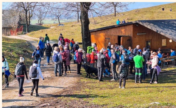
Postanek nad Smokučem za pohodnike na Poti kulturne dediščine Žirovnica