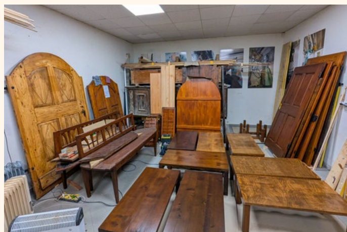
Obnovljeni leseni deli v delavnici.

Tudi obnova gospodarskega posloplja poteka po načelu ohranjanja prvotnih elementov, če je to le mogoče. Jernej Mrak, Kovinar – gradnje ST: »Ob začetku del se je bilo treba prilagoditi dejanskemu stanju. Ko smo odstranili obloge na zgornjem delu skednja, se je izkazalo, da je les marsikje v slabem stanju in zamenjati smo morali več elementov, kot je bilo prvotno mišljeno. Sicer obnova poteka po načrtu, vsa dela so izvedena v skladu z zahtevami in pod nadzorom ZVKD.«