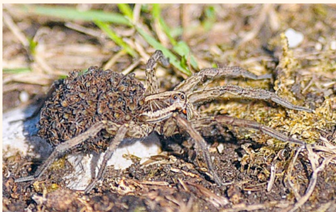
Samica z naraščajem na pašniku nad Rodinami.

Veliki roparski volkec ( Pisaura listeri ) je prav zanimiv med številnimi vrstami pajkov. Živi na travnikih in pašnikih v nižinah. Med hitrim tekom lahko tudi skače in tako lovi plen, saj ne prede mreže. Trup ima velik do 13 milimetrov. Če vas ugrizne ne bo hujših posledic, le mesto ugriza bo oteklo in bo srbelo.