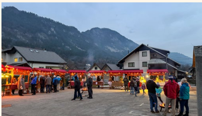
Adventni sejem na dvorišču Pastoralnega doma

V soboto, 14. decembra 2024, se je po vzoru mnogih krajev tudi v naši občini odvil adventni sejem. Glavno prizorišče je bilo na dvorišču Pastoralnega doma na Breznici, kjer so bile postavljene stojnice, na katerih so ponudniki med 15. in 18. uro prodajali svoje izdelke in pridelke. Med ponudniki je bilo mnogo domačih imen, a prišli so tudi od drugod, denimo celo iz Goriških Brd. Za obiskovalce sejma je bilo poskrbljeno tudi v gastronomskem smislu, saj je bilo moč dobiti vse od čaja do kuhanega vina in od pečenega kostanja do cesarskega praženca oz. »šmorna«. Še bolj prijetno vzdušje so ustvarili glasba, lučke in ognjišče, ob katerem so se mnogi pogreli med ogledovanjem stojnic in druženjem. Upamo, da se v letošnjem letu ponovno vidimo na adventnem sejmu.