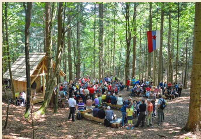
V obnovljeni Titovi vasi. Slovesnost ob otvoritvi junija 2014.

Nemci so se 30. januarja zvečer iz raznih smeri začeli približevati vznožju Stola in blokirali ves ta sektor. Pripravljali so se na soča- sni napad tako na 1. bataljon kot tudi 2. bataljon, ki je taboril v Dragi pri Begunjah. V jasni noči na 31. januar so nemške enote krenile proti obema taboroma. Pozorni stražarji so nemško ko- lono iz Smokuškega vrha opazili okoli 3. ure ponoči. Zatem je bil sovražnik zaznan tudi iz smeri Žingarice, zato so se čete razpo- redile na svoje položaje po predhodnem dogovoru. Ena četa se je povzpela na greben Smokuškega vrha in Gosjaka, z njo je bil tudi komandant, druga nad Žingarico v smeri proti Jesenicam in