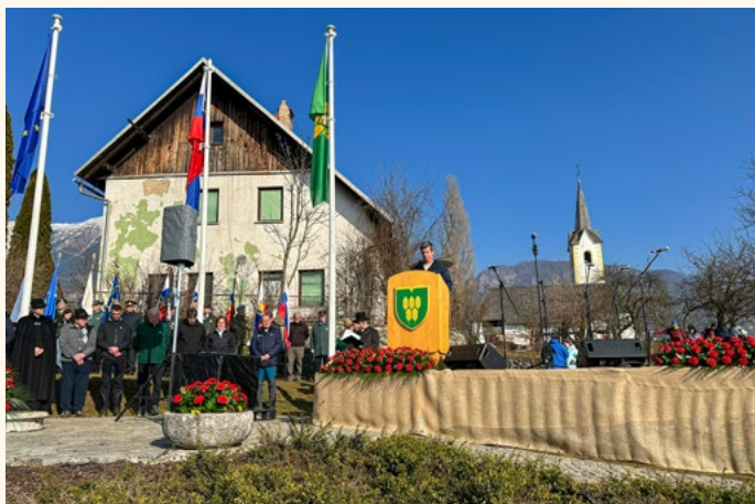
Osrednja proslava v Vrbi.