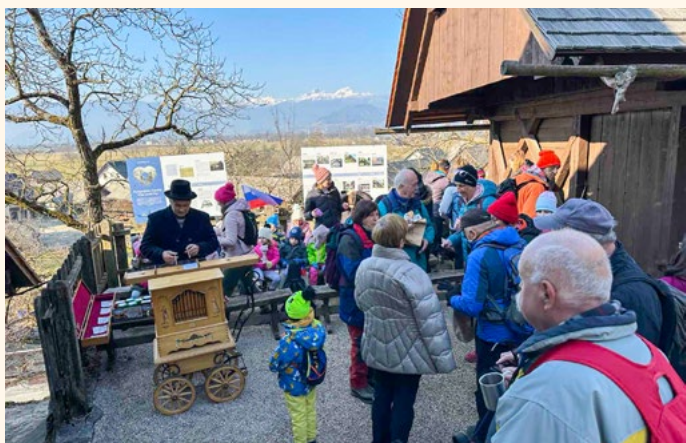
Pri Finžgarju je igrala lajna.