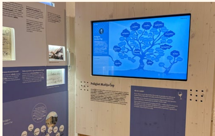
Drevo jezikov ponuja interpretacijo Zdravljice v desetih jezikih.

Razstava o življenju in delu Matije Čopa v njegovi rojstni hiši v Žirovnici je obogatena z novo vsebino. Na posebnem panoju si obiskovalci lahko predvajajo Zdravljico v desetih jezikih.