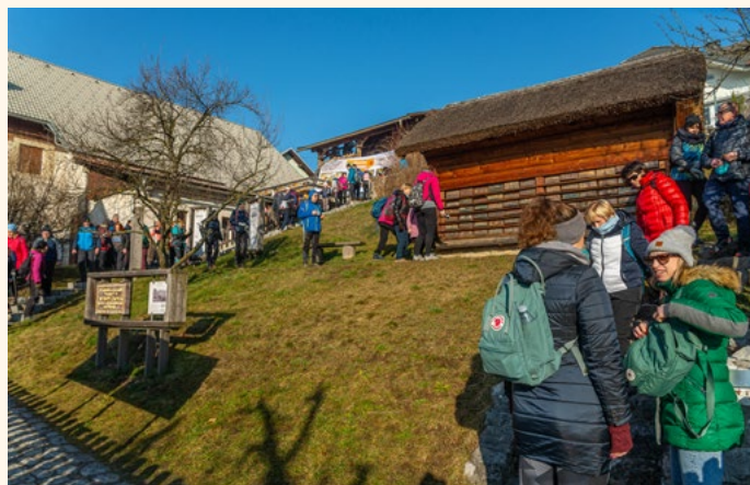
Čebelarji so ob ogledu čebelnjaka ponudili pokušino čebeljih izdelkov.