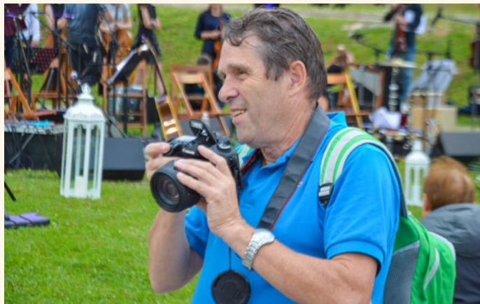
Ferdo – neutrudni fotograf. Prešerna noč v Vrbi 2018

Glasba je bila od vsega začetka moja velika ljubezen. Kot desetletni fantič sem se v domačem kulturnem društvu na Hrušici začel ukvarjati z notami, društvo mi je potem omogočilo učenje klarineta na nižji glasbeni šoli. Kot mladenič, bil sem najmlajši v skupini, sem se kalil v domači hrušičanski godbi. Glasbeno pot sem nadaljeval z jeseniškimi godbeniki, leta 1982 pa sem postal član Pihalnega orkestra Lesce. Ves čas sem aktiven tudi v različnih odborih in komisijah v kraju in tudi v slovenskem prostoru.