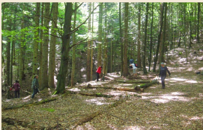
V Titovi vasi maja 2012.