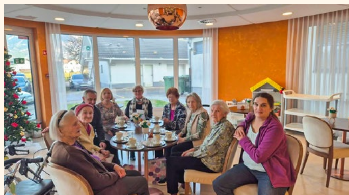
Obisk v Domu dr. Janka Benedika

Decembra smo poverjenice društva članom, starim 80 in več let, prinesle na dom 290 božično-novoletnih voščilnic in setvenih koledarjev. Prav tako smo naše članice in člane v času praznikov obiskali v domovih za starejše. Našim članicam in članom iz drugih občin smo novoletne voščilnice in koledarje poslali po pošti.