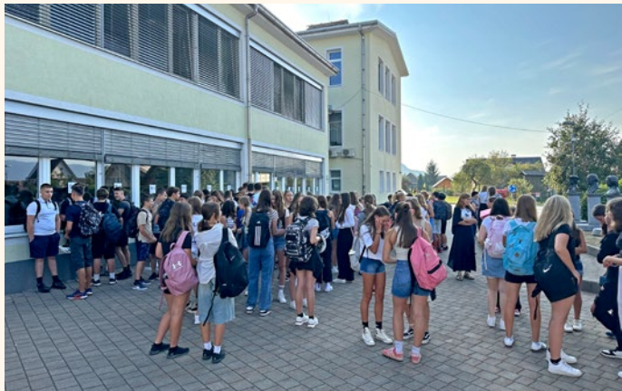
Ponovno med sošolci

Prvi šolski dan so starši v Osnovno šolo Žirovnica pospremili 51 prvošolcev. Za učence 3. in 5. razreda se je pouk pričel s šolo v naravi. Prvega šolskega dne se učenci, kot so povedali, najbolj veselijo, »ker se ponovno vidijo s sošolci«.