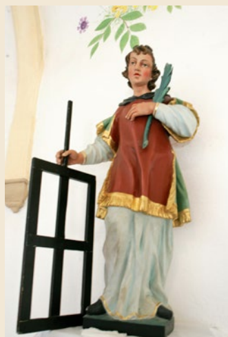
Kip sv. Lovrenca.