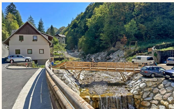
Brv za pešce in kolesarje