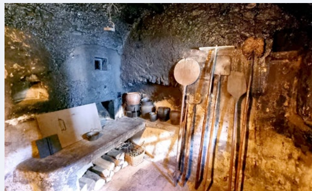
Črna kuhinja v Prešernovi rojstni hiši. Foto Borut Juvanec, 2023

Zavedamo se, da je dediščina dragocen vir znanja in navdiha, ki nas povezuje s preteklostjo in oblikuje našo prihodnost. Zato je ključnega pomena, da se o njej pogovarjamo, raziskujemo njene različne vidike in si prizadevamo za njen trajnostni razvoj. Vaša udeležba na konferenci bo pomemben prispevek k našim skupnim prizadevanjem za ohranjanje dediščine. Vabljeni!