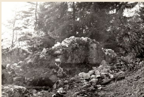
Ruševine cerkve svetega Lovrenca