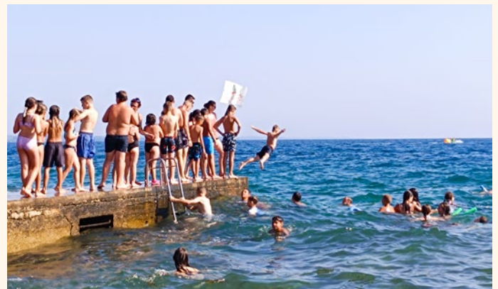
Tekmovanje v skokih v vodo

V zgodnjih jutranjih urah smo se dobili pred OŠ Žirovnica, kovčke naložili na avtobuse in se odpravili na pot, saj so nas barvne hiške že nestrno pričakovale. Med potjo smo si pripovedovali različne zgodbe, vice in se spraševali, kakšna tema nas čaka to leto. Zvečer smo le izvedeli, da bomo 10 dni preživel kot Rimljani, ki bodo cesarju z dobrimi deli in trudom nabrali dovolj veliko vojsko, da bomo skupaj premahal Hanibala in njegove slone. Tako se je vsak dan zvrstilo več aktivnosti, nekatere športne, spet druge umetniške narave, tretje pa so preizkušale naše razmišljanje ali pa timski duh. Ples norih frizur, drča, nočno kopanje, olimpijske igre in igra ujemi so bile le nekatere aktivnosti, s katerimi smo si kratkočasili dni v senci borovcev. Seveda nismo pozabili na zabavo in se zvečer večkrat veselili ob divjem plesu, ogledu filma ali se podali v Novigrad. Zabavno je bilo tudi na izletu z ladjico do Poreča.