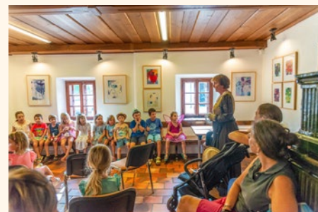
Dogodek za najmlajše – pravljичno popoldne z Zvezdico Zaspanko v Čopovi hiši.

Nastopajoči so nad našo Žirovnico popolnoma očarani. Vedno znova izpostavljajo čarobni ambient pri Finžgarjevi rojstni hiši, Završnica z okoliškimi gorami in jezerom je prav tako doslej navdušila vse nastopajoče. Pravijo, da kljub velikemu številu gledalcev, še vedno občutijo butičnost dogodkov, kot da se družijo s prijatelji ob taborniškem ognju, ne pa nastopajo pred tisočglavo množico. Prešerno noč z Aleksandrom Mežkom v Vrbi pa so zaradi domačnosti gledalcev in prijetnega prizorišča na travniku že pred leti nastopajoči oklicali za »Mežkov Woodstock«.