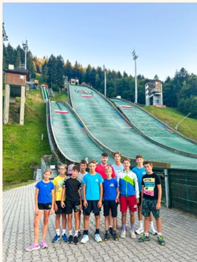
Na pripravah v Szczyrku

Letos so bili v skakalnem centru Szczyrk na Poljskem. Vsak dan so opravili skakalni trening, trening vzdržljivosti ter trening gibljivosti in koordinacije. Prosti čas so namenili druženju ob različnih igrah.