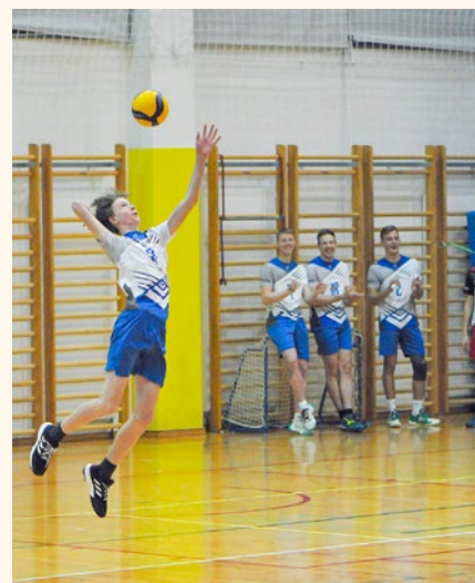
Vid na servisu proti članski ekipi iz Črnuč