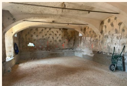
Bodoči razstavni prostor v nekdanjem hlevu

Prva dva meseca je glavnina del potekala na gospodarskem posloplju. Pričeli so z rušenjem nedovoljeno zgrajenega prizidka in odstranjenjem neuporabnega materiala. Med lesenimi elementi bo po besedah izvajalca nekatere moč restavrirati in vrniti v objekt, večinoma pa bodo nadomeščeni z novimi.