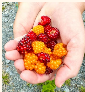
Gozdni sadeži Aljasko

izkoriščanje tega naravnega vira. Aljaska je znana tudi po gozdovih, kar 35 % države je pogozdene. Ceste so redke, v mestih mogoče dolge le po 10 kilometrov v vsako smer. Prebivalci potujejo z ladjami ali letali. Alaskan Air je najbolj znana letalska družba, je pa ogromno manjših ponudnikov. Včasih imajo tudi prebivalci svoja letala, saj jih na dolgi rok to stane precej manj. Zanimiva je tudi aljaška zastava – na modri podlagi se svetijo zvezda severnica in ozvezdje velikega voza.