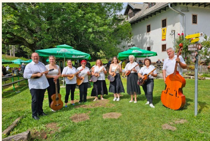
Nastop Kašarjev na Pristavi v Javorniškem Rovtu