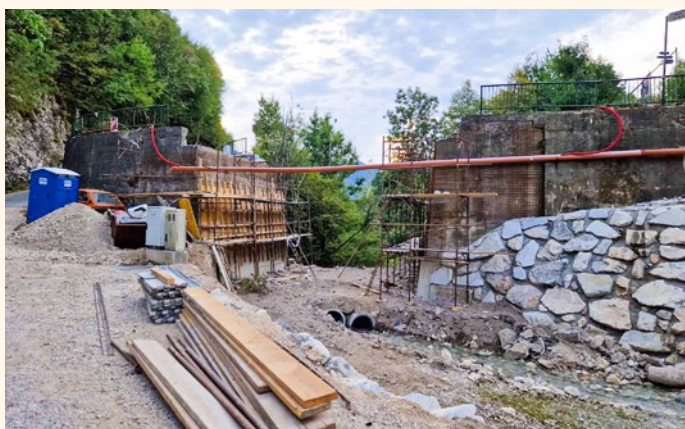
Novi most v izgradnji