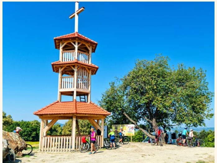
Sotinski breg, 418 m.n.v., najvišji vrh Prekmurja, domačini mu pravijo prekmurski Triglav

Nedelja, zadnji dan, ali »Nekateri so za vroče« in, ja, res je bilo vroče, še dobro, da smo imeli pred seboj traso z »zgolj« 60 km, vmes pa nekaj osvežilnih postankov za preprečitev dehidracije.