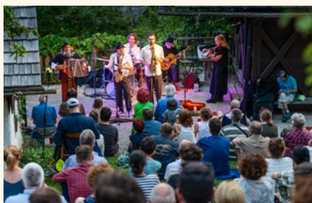
Nastop skupine Čompe pri Finžgarjevi rojstni hiši je bil eden odmevnejših dogodkov letošnjega KašArta.

Letošnji KašArt je bil po obsegu in raznolikosti dogodkov najbolj pester v svojih štirih letih obstoja pod tem imenom. Poleg glasbenih in pripovednih dogodkov smo festivalu dodali še slikarsko, gledališko in filmsko umetnost kot tudi vsebine, primerne za otroke. Izjemno smo ponosni, da vsako leto privabimo kakovostne in priznane slovenske ustvarjalce, ki s svojim delom puščajo sledi tudi v tujini. Odzivi obiskovalcev so bili izjemno pozitivni, prejeli smo veliko pohval glede kakovosti programa in organizacijskih zadev, kot so parkiranje, zvok, gostinska ponudba. Veseli smo, da obiskovalci prihajajo z vseh koncev Slovenije. Beležili smo tudi veliko turistov, ki so bili nastanjeni v Žirovnici ali okoliških krajih. Po številu obiskovalcev smo presegli rekordne številke iz leta 2023. Predvsem pa smo ponosni, da na KašArtu promoviramo ohranjanje naravne in kulturne dediščine ter s popularnimi vsebinami podpiramo naše poslanstvo.