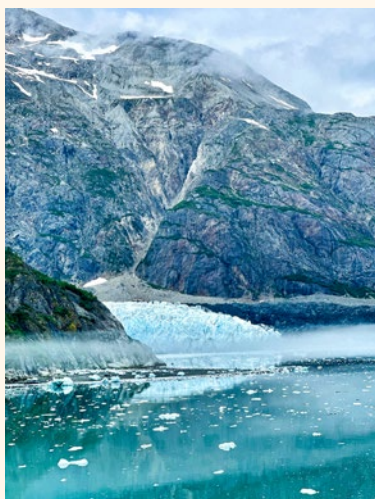
Ledenik Margerie, Glacier Bay

pa navihanost. Ostali simboli ponazarjajo prednike, zgodovino in privilegije plemena. Totem se rezlja približno 4 do 6 mesecev, celoten postopek je ročno delo z uporabo le štirih orodij. Znanje rezbarjenja se prenaša iz roda v rod, najprej samo z opazovanjem, potem z rezljanjem. Drevesa so za plemena kot strici – učijo jih modrosti in dajejo energijo. Plemena še danes živijo skupaj, na sredini vasi je hiša klana, kjer se zbirajo, praznujejo, zabavajo, modrujejo, rešujejo probleme. Okoli naselij so tudi druge kolibe, večinoma za shrambo hrane, »črna kuhinja« za dimljenje mesa, družinske brunarice. Če se pleme seli, je edina hiša, ki jo vzamejo s seboj, hiša klana, vse ostalo zapustijo. Družine so velike, imajo tudi več kot šest otrok. Živijo v skladu z naravo. Vsi se ukvarjajo z ribolovom in lovom. Vsak član družine lahko ujame štiri jelene letno, poleg tega pa prehrani dodajo še ogromno količino lososa in ostalih rib ter rakov. Dieto obogatijo še s pisano paletno jagodičevja. Tudi mi smo poskusili toliko različnih gozdnih sadežev, da jih niti ne znamo naštet. Od vseh nas je najbolj očarala oranžno obarvana »lososova jagoda«. Jagod pa nismo jedli samo mi – z njimi se radi posladkajo veliki kosmatinci, rjavi in črni medvedvi.