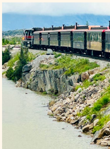
White Pass in Yukon železnica

Zlato je še en delček zanimive zgodovine Aljasko. Tako imenovana »zlata mrzlica Klondike« je v letih med 1896 in 1899 v regijo Yukon pripeljala več kot 100.000 migrantov v iskanju