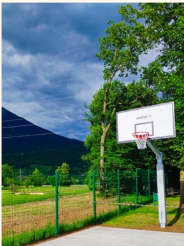
Nov koš na otroškem igrišču