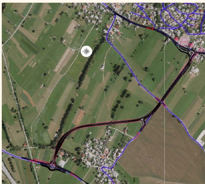
Potek trase obvoznice Vrba

Župan Leopold Pogačar: »Trideset let čakanja na obvoznico je bilo dovolj, zadnji čas je, da se gradnja začne. Preden bo končana prva faza, bosta rešena tudi birokratska postopka z odkupom zemljišč, da bomo tudi za ta del obvoznice lahko pridobili gradbeno dovoljenje.«