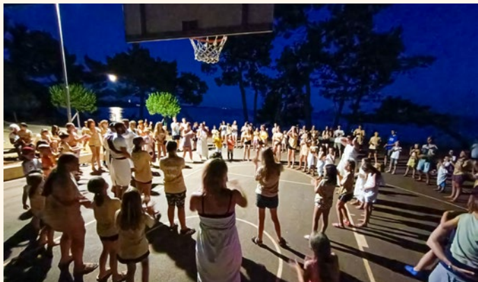
Ples v rimskem stilu

Ni enostavno, greš v okolje, ki ga ne poznaš. Ne poznaš nikogar, osebja, vodičev, kako me bodo sprejeli, kako bo? Skrb se je kmalu zmanjšala, vtis na avtobusu in pri postanku je bil prijeten. Živčnost je počasi popuščala. Skušala sem se nevsiljivo vklopiti. Vodiči so bili mladi, polni idej, zanosa, ljubezni, vse za otroke.