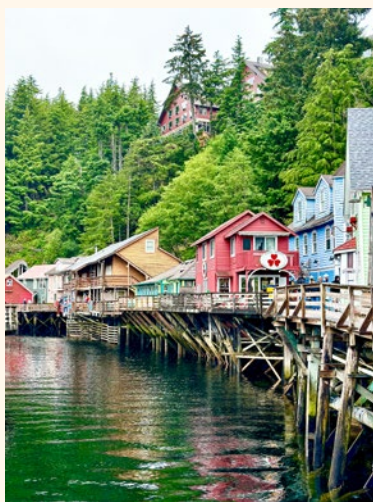
Ketchikan - prestolnica lososov

Aljaska nam je burila domišljijo že vse od kultne serije 90-ih, Severnih obzorij. Še igranje zunaj je bilo vredno izpustiti, samo da smo si lahko ogledali prigode dr. Fleischmana in družine. Fantje so bili v večini do ušes zaljubljeni v pilotko Maggie, medtem ko je puncam srce hitreje bilo ob radijskem napovedovalcu Chrisu. To kar smo videli v seriji, smo poistovetili z Aljasko, največjo in predzadnjo zvezno državo ZDA. Prelepa pokrajina, divja narava, raznovrstne živali, ki se prosto sprehajajo kjer jim paše, staroselci Indijanci pomešani s pisano družino prišlekov iz vseh koncev sveta, ki so nekako končali tam daleč na severu. »Severna obzorja« smo z družino raziskovali letošnje poletje.