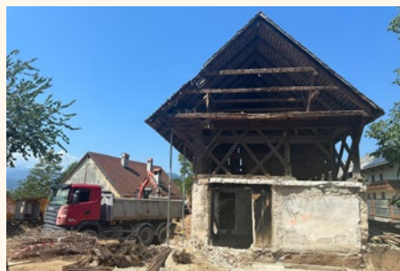
"Okleščeno" gospodarsko posloplje