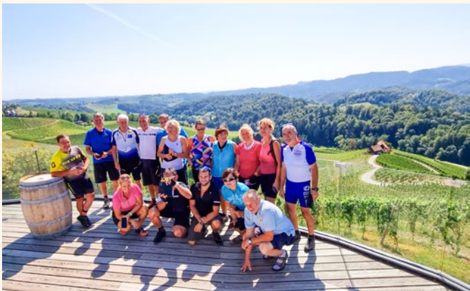
Del kolesarjev na Špičniku, znamenita cesta v obliki srca – Srce med vinogradi

Petkovo jutro smo začeli zares zgodaj, ob svitu. Ob 6. uri zjutraj nas je avtobus odpeljal novim dogodivščinam naproti. Na startu se nas je letos zbralo 31. V Mariboru smo sedli na kolesa, preverili, če vse »štima« in se, kot je že običaj, razdelili v dve zahtevnostni skupini. Okrog 95 km je bilo pred nami. Pot nas je vodila po Slovenskih Goricah, v Špičniku, vožnja po znamenitem srcu – Srce med vinogradi, je bila prelepa, slikovita, predvsem pa vroča. Na vrhu smo bili poplačani s prelepim razgledom na srce in ostalo vinorodno pokrajino. Naprej smo se zapeljali po razgledni vinski cesti k sosedom v Avstrijo, kolesarili po obmurski kolesarski poti, mimo Murecka, Gornje Radgone in vse do težko pričakovanega cilja, kamor smo se žejni in lačni pripeljali po zaključnem vzponu. V Gostišču Aleksander na Rumičevem bregu pri Moravskih toplicah so dva dneva odlično skrbeli za naše počutje.