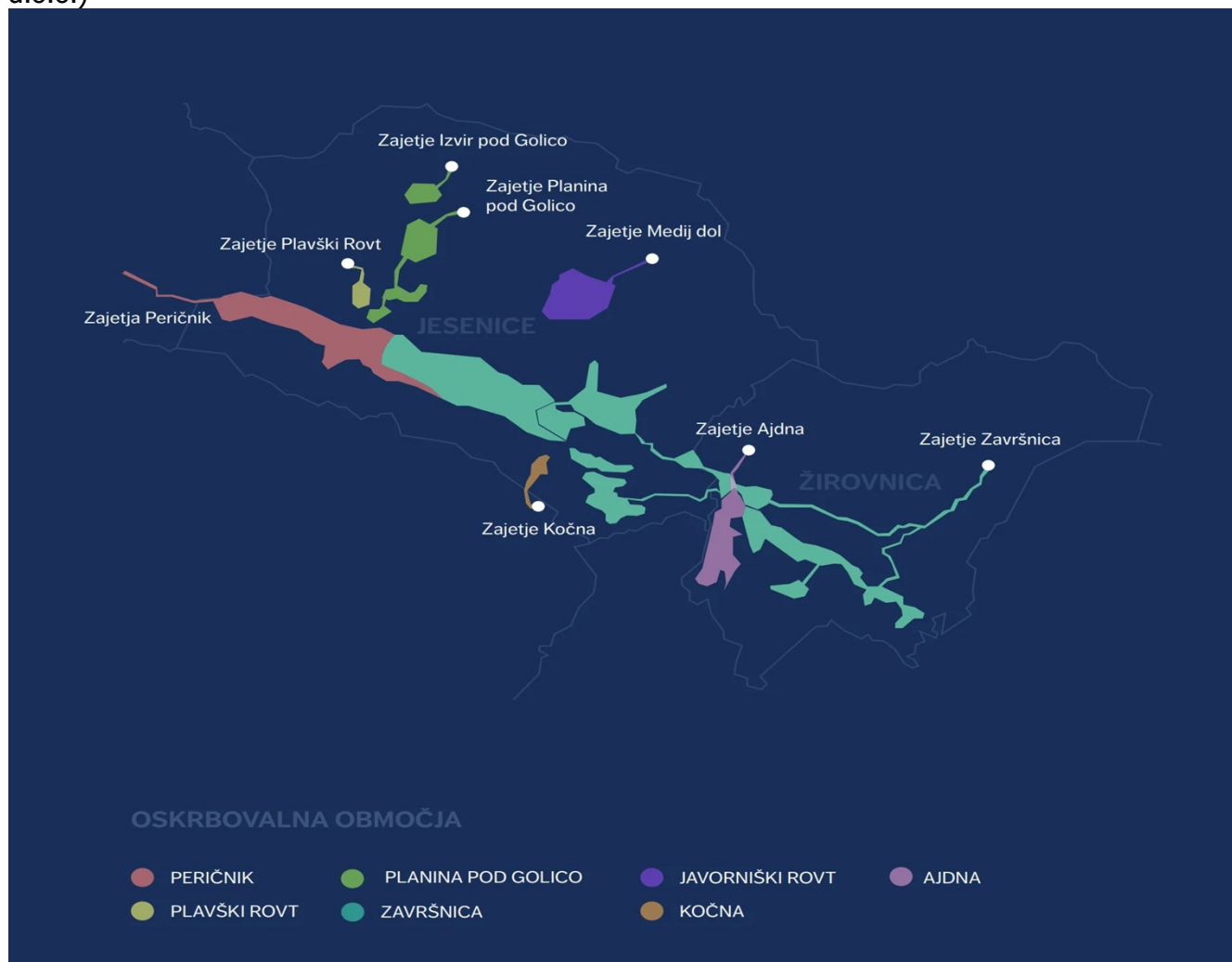
Slika 1: Shema vodovodnih sistemov v občini Žirovnica in občini Jesenice (Vir: JEKO, d.o.o.)

Preglednica 1: Vodovodni sistemi z dolžinami cevovodov in količino distribuirane vode (Vir: JEKO, d.o.o.)